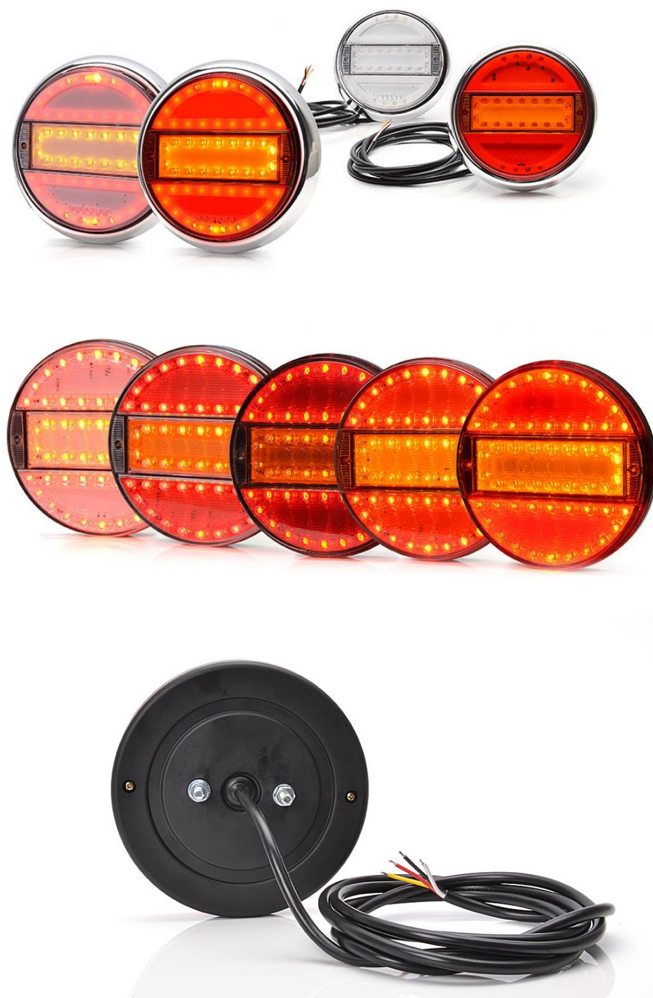
Abbildung Heckleuchten-Beispiele / picture of rear lamp samples