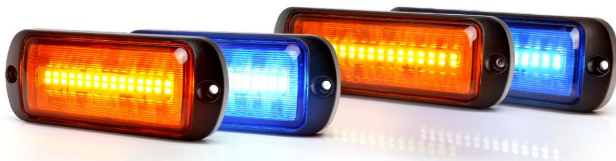
Abbildung Leuchten-Beispiele / picture of lamp samples